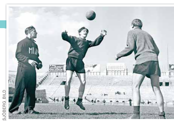
LEGENDERNA. Gunnar Nordahl, Gunnar Gren och Nils Liedholm bildade den legendariska fotbollstrion Grenoli och ledde det svenska herrlandslaget till OS-guld 1948.

■ Tävlingarna sågs av ungefär 1,2 miljoner åskådare. ■ Sveriges knep 17 guldmedaljer, 11 silvermedaljer och 18 bronsmedaljer. Bland guldmedaljörerna fanns bland annat det svenska fotbollslandslaget med namn som Gunnar Gren och Gunnar Nordahl.